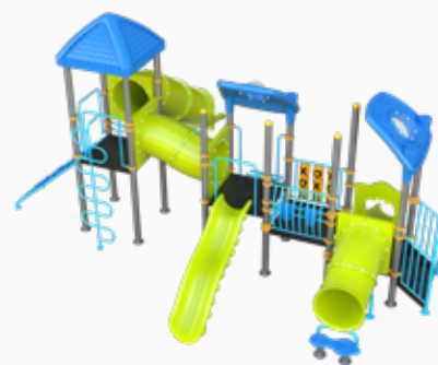
Vista perspectiva posterior