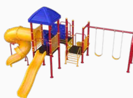
Vista perspectiva posterior