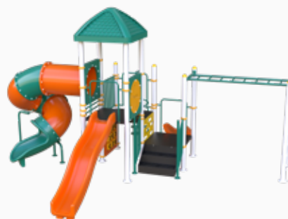
Vista perspectiva posterior