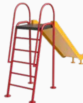
Vista perspectiva posterior