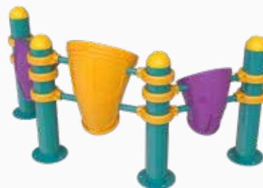
Vista perspectiva posterior