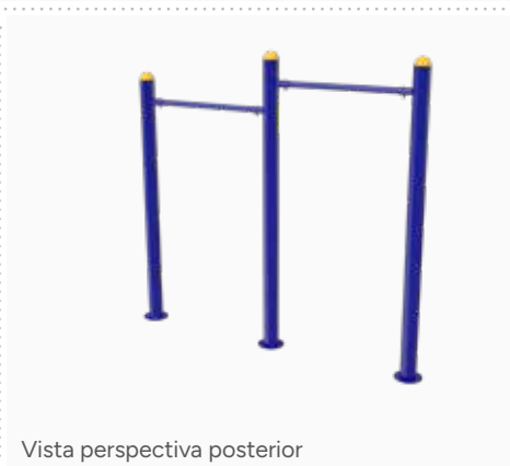
Vista perspectiva posterior