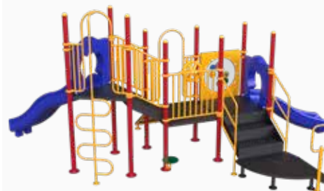
Vista perspectiva posterior