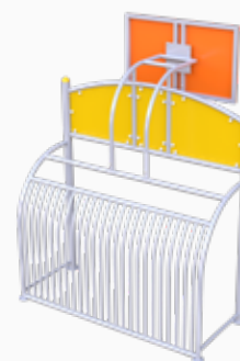
Vista perspectiva posterior