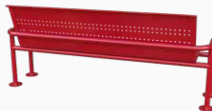
Vista perspectiva posterior