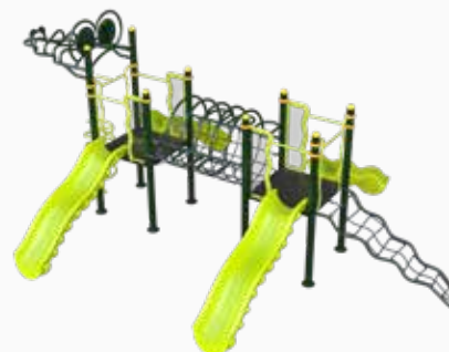
Vista perspectiva posterior