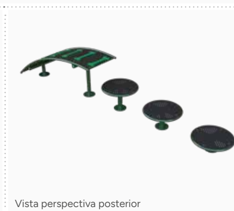
Vista perspectiva posterior