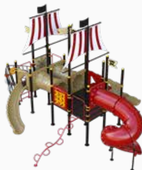
Vista perspectiva posterior