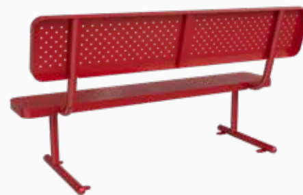
Vista perspectiva posterior