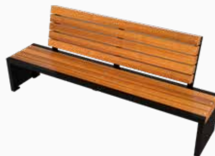
Vista perspectiva posterior