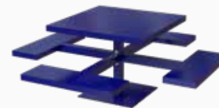
Vista perspectiva posterior