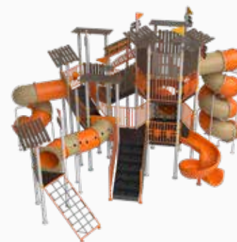
Vista perspectiva posterior