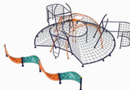
Vista perspectiva posterior