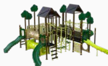
Vista perspectiva posterior