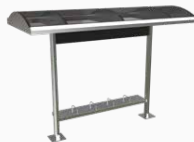
Vista perspectiva posterior